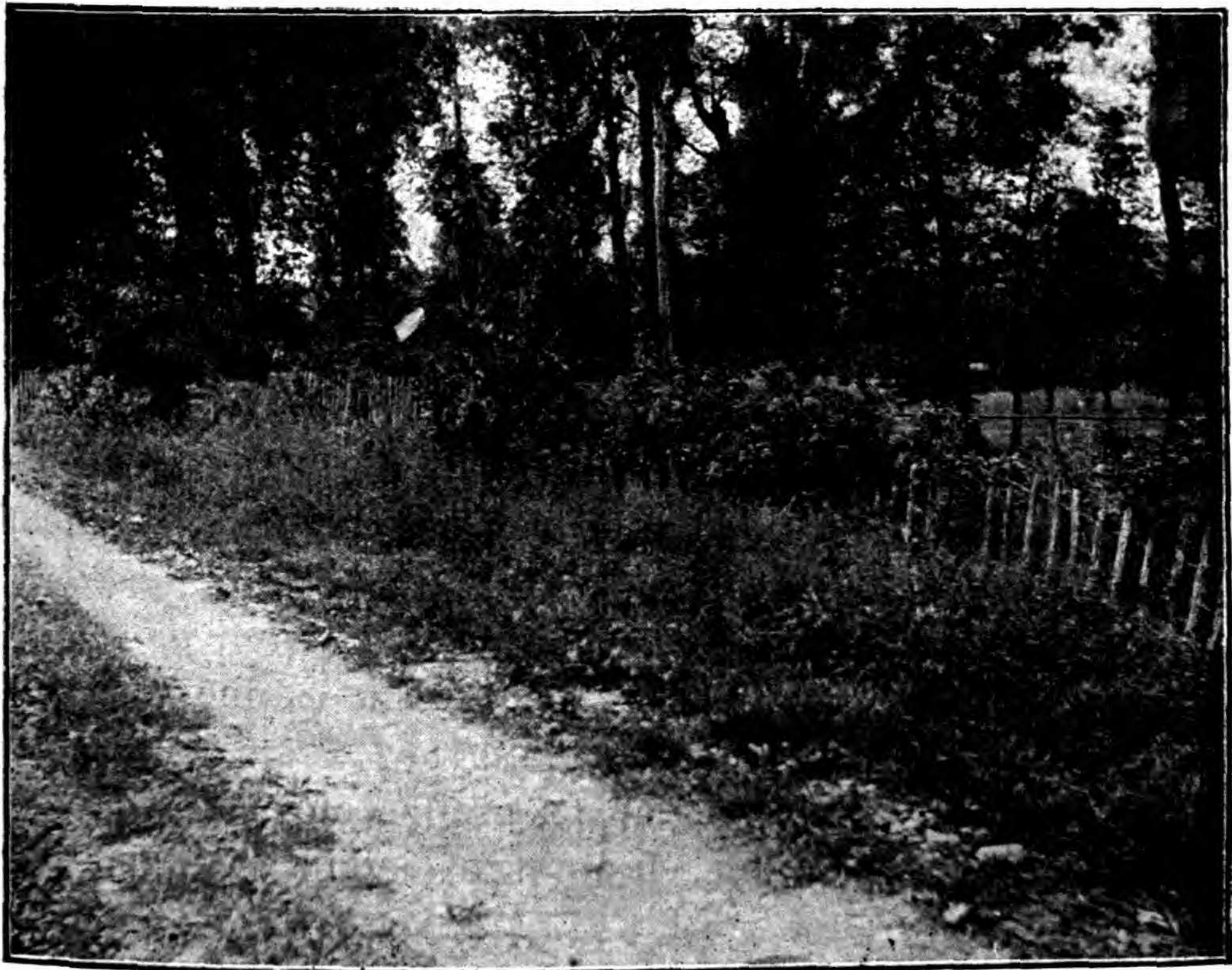
Fig. 2. — Vue d'ensemble (inverse de la fig. 1) de la station de Challes-les-Eaux.

Loire. — En 1881, M. ORMEZZANO de Marcigny (Saône-et-Loire) la recueillait abondamment à Briennon (Loire), où elle couvrait des champs entiers (D r GILLOT); Saint-Galmier (champ dans la plaine), FAUSTINIEN in Soc. Dauph. exsicc. , n° 1739 bis, 1879; Noirétable, 1879 (abbé SOUCHON); Veauche (cultures, trouvé une fois, très rare (abbé HERVIER, Recherches sur la flore de la Loire , 1 er fasc., Saint-Etienne, 1885, p. 35).